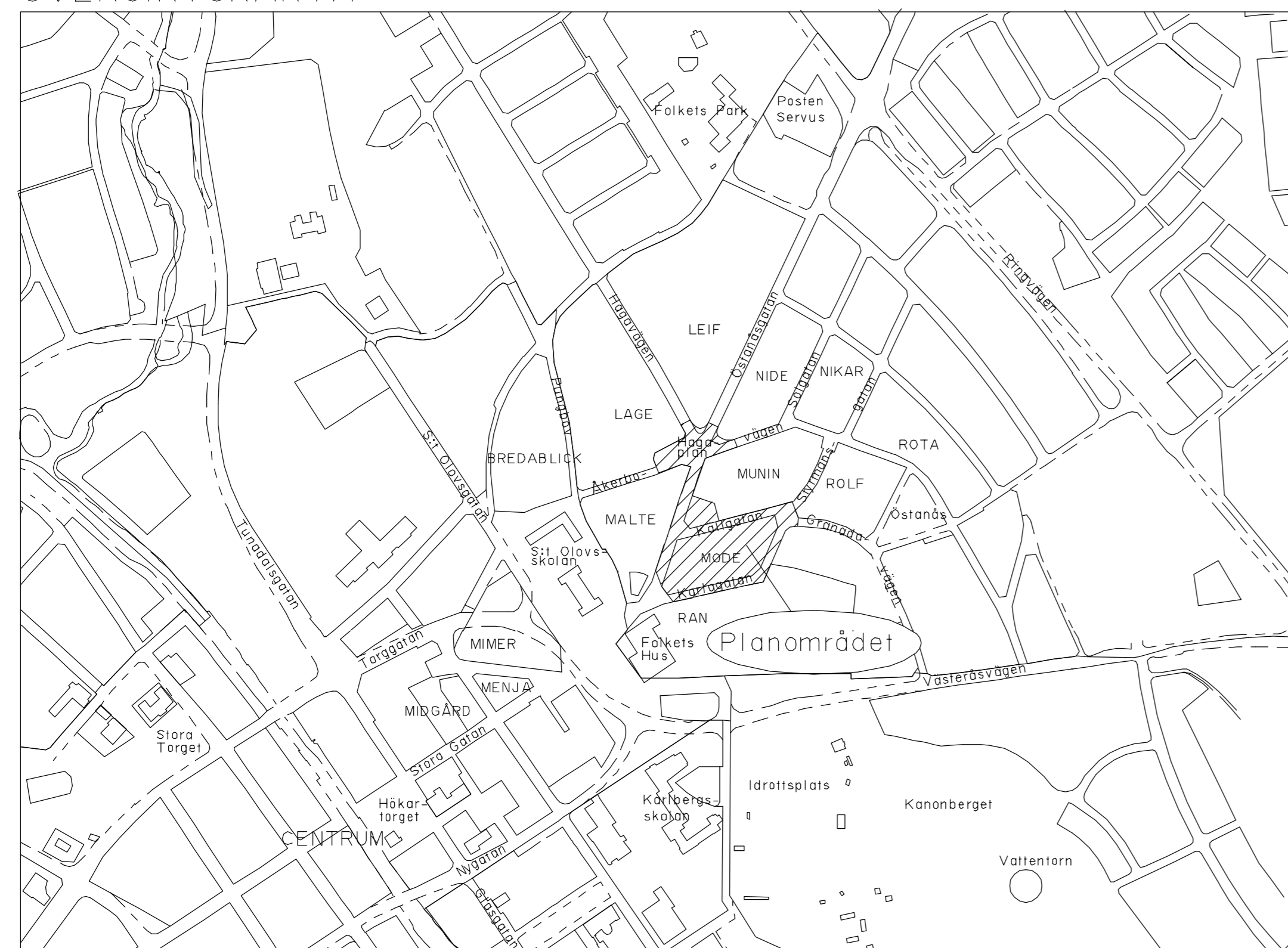
Skala 1:5000 0 50 100 150 200 250 500 750 m