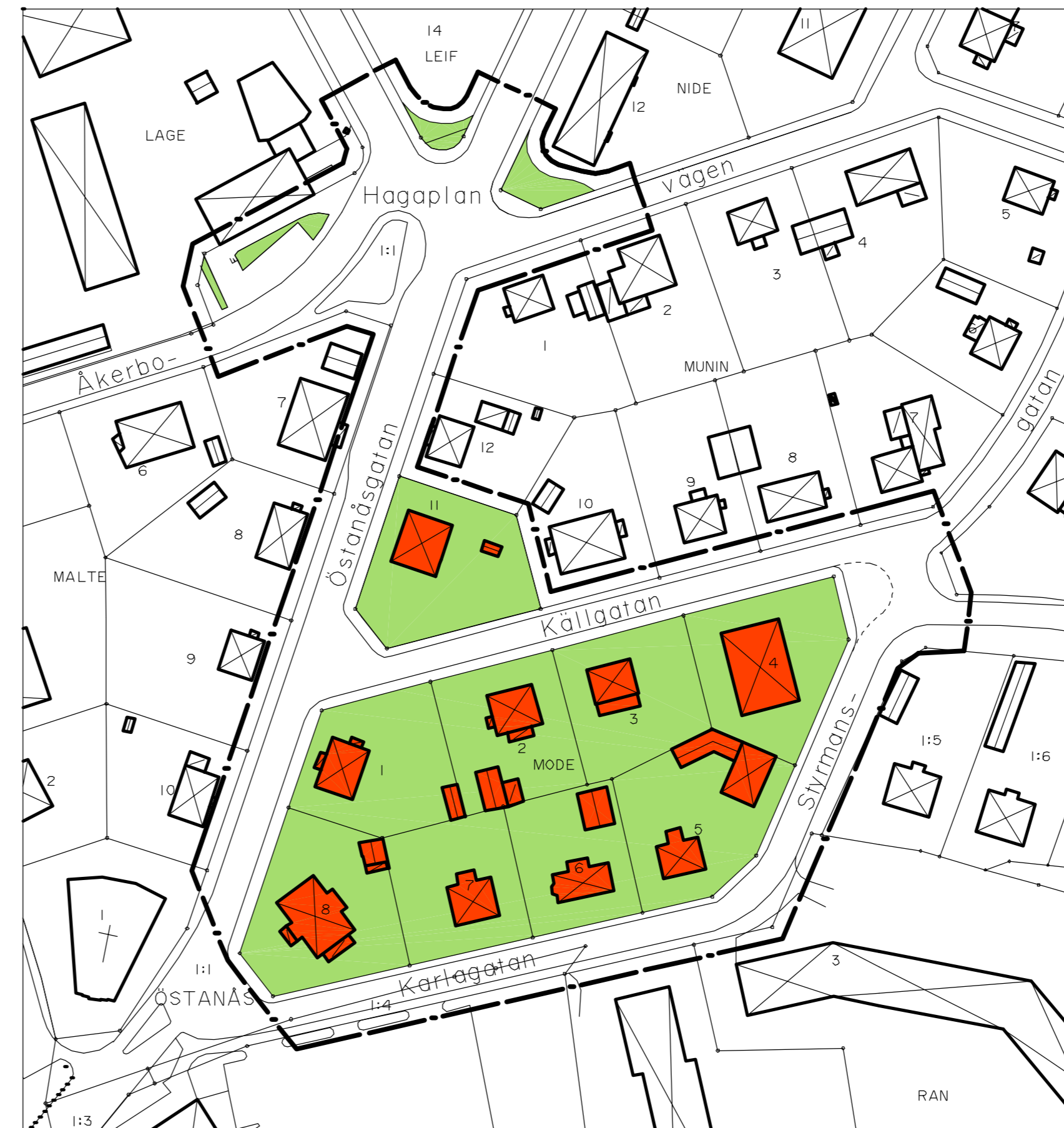
Skala 1:1000 0 10 20 30 40 50 100 150 m