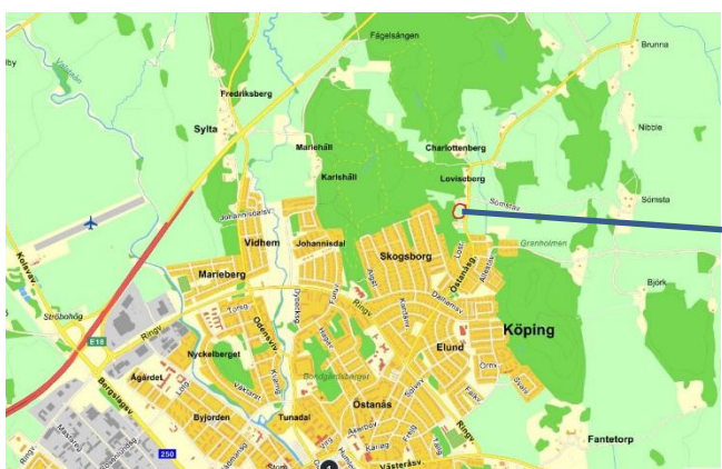
Figur 1.1 Detaljplaneområde markerat med rött.

Tyréns har på uppdrag av Köpings kommun gjort en bedömning av byggbarheten i ett detaljplaneområde i Västra Sömsta, Köping (figur 1.1). Geotekniska fältundersökningar utfördes i samband med en dagvattenutredning i samma område varav tre punkter är lokaliserade inom detaljplaneområdet. Undersökningens omfattning finns beskriven och redovisad i plan och sektion i bifogad MUR (markteknisk undersökningsrapport) daterad 2017-10-06. Dessa tre punkter, tidigare geotekniska undersökningar utförda av andra konsulter, observationer av fältgeotekniker och SGU:s jordartskarta har utgjort grunden för detta PM. Observera att detta PM är av översiktlig karaktär, för detaljprojektering av grundkonstruktioner och fyllningar erfordras en detaljerad geoteknisk utredning.